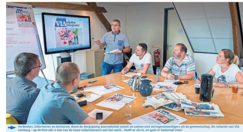
'Lokale journalistiek samen met de gemeenschap'

Wie, hoe de bron voor lokaal nieuws. Wie het nieuws van de laatste specht en leek, die leest van op de foto en de namen van de lokale redactie. Het is een combinatie van lokale journalistiek en de gemeenschap. De redactie van VIA Limburg - op de foto - is een van de meest actieve van het land. Het is een team van lokale journalisten die samen met de gemeenschap de lokale nieuws voor de provincie Limburg. De redactie van VIA Limburg - op de foto - is een van de meest actieve van het land. Het is een team van lokale journalisten die samen met de gemeenschap de lokale nieuws voor de provincie Limburg.